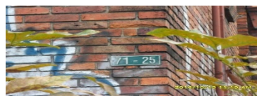
NOMENCLATURA DEL PREDIO